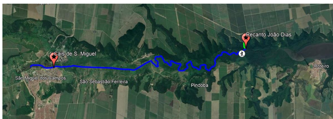
Figura 1. Rota do Passeio pelo Rio São Miguel

Fazemos a rota, conforme a Imagem 1, e conhecemos a fauna e flora em torno do Rio. Antigamente, essas margens eram habitadas pelos índios caetés.